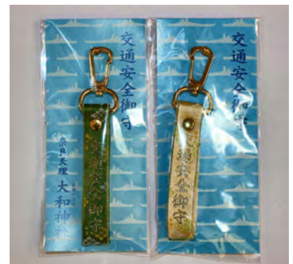
キーホルダー (交通安全御守) (青・ベージュ) 初穂料 各500円