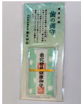
歯の御守 初穂料 800円