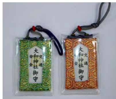
交通安全御守(青・赤) 初穂料 各500円