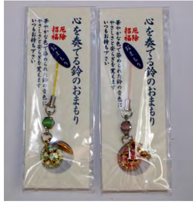
鈴のお守り初穂料 初穂料 各700円