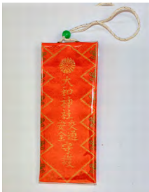
交通安全御守(大) 初穂料 1,000円