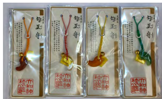
勾玉守(茶・白・黄・緑)