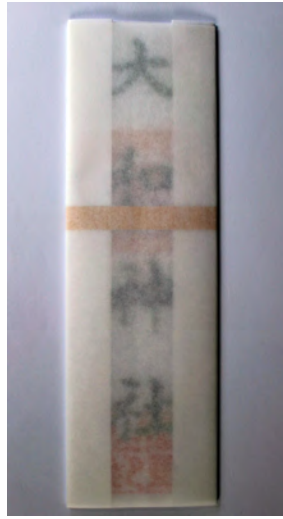
大和神社神符(紙) 初穂料 1,000円