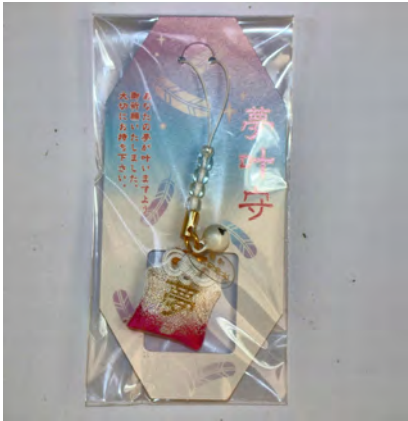
夢叶守 初穂料 700円