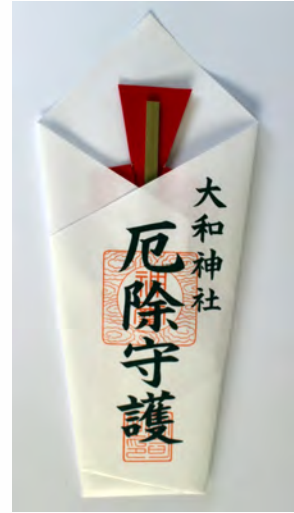
厄除守護 初穂料 500円