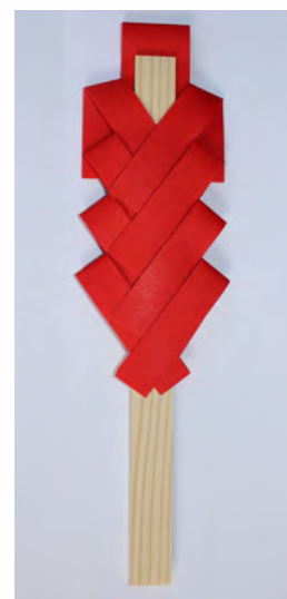
赤御幣 初穂料 500円