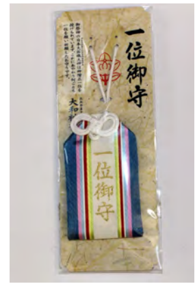
一位御守 初穂料 1,000円