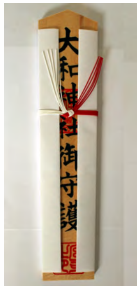
大和神社御守護 初穂料 2,000円