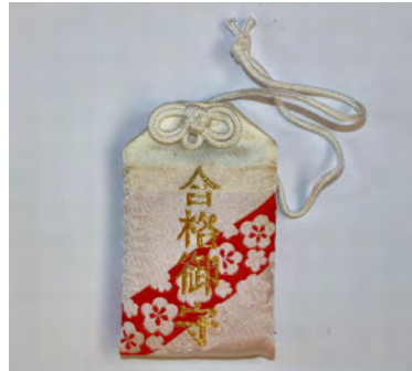
合格御守 初穂料 1,000円