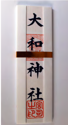
大和神社神符(木) 初穂料 1,500円