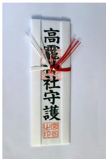
高麗神社守護 初穂料 1,000円