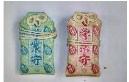
学業守(青・赤) 初穂料 各500円